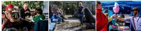
Hierboven een kleine impressie van onze allereerste verwendag. Voor een uitgebreider (foto)verslag zie ook onze website "Verwendag 2025" en "Nieuws"

Stichting Walcheren voor Lotgenoten is een jonge organisatie, opgericht in 2024, met een groot hart voor kinderen en hun gezinnen die door kanker worden getroffen. Onze eerste verwendag in 2025 was een groot succes met 150 bezoekers. Op onze tweede verwendag zouden we graag willen groeien naar zo'n 200 bezoekers. Inmiddels hebben we al zo'n 75 aanmeldingen en dat is fors meer dan vorig jaar rond deze tijd.